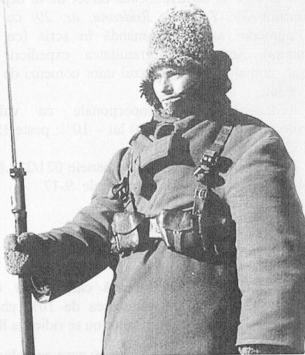
Soldat român păzind frontiera României pe Nistru la Tighina, ianuarie 1940.